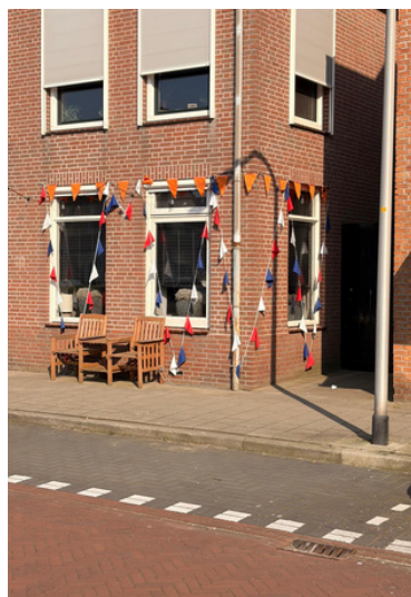
E.A. Borgerstraat 47