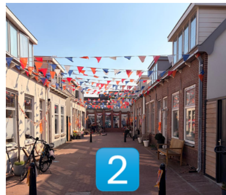
Jan Tooropstraat (gedeeltelijk)